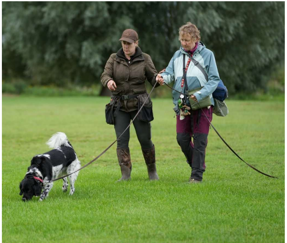
Zweetwerk tijdens de DOE dag

Qua organisatie heeft de jachtcommissie een aantal verbeterpunten gesignaleerd en die gaan we doorvoeren voor de volgende DOE-dag in 2024.